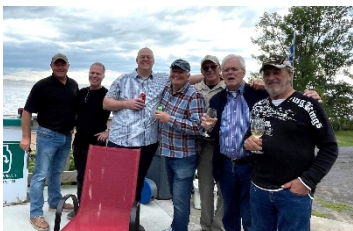
Un groupe de rotariens solidaires