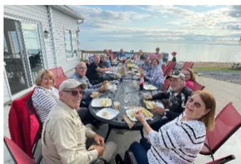
Une tablée remarquable